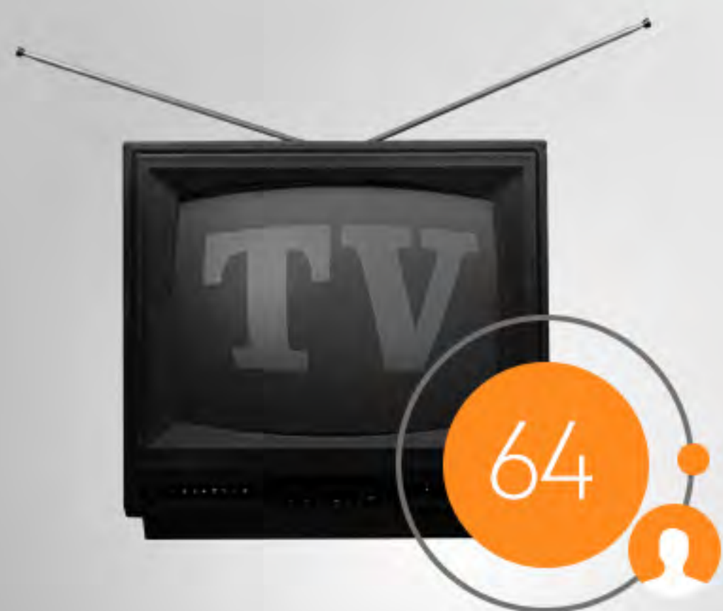
פרסום שיווק ויח"צ